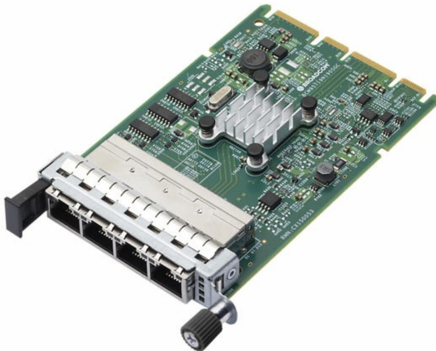
Figure 2. ThinkSystem Broadcom 5719 1GbE RJ45 4-port OCP Ethernet Adapter

The following figure shows the Broadcom 5719 1GbE RJ45 4-port OCP Ethernet Adapter.