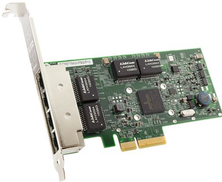
Figure 1. Broadcom NetXtreme I Quad Port GbE Adapter

Figure 1 shows the Broadcom NetXtreme I Quad Port GbE Adapter.